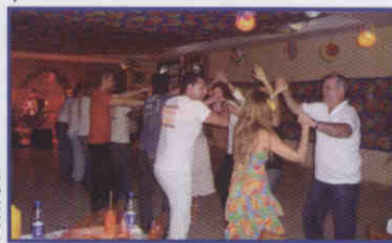
Servidores fazem o túnel