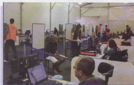
TRE- RJ: técnicos exibem a urna biométrica

Surpreendidos com a eficácia da sistemática utilizada, os representantes deste Regional voltaram encantados e prontos para, como multiplicadores, disseminarem o conhecimento apreendido com os demais colegas de Pernambuco, objetivando alcançar o êxito esperado nos municípios escolhidos pelo Pleno para dar início à utilização das urnas biométricas em nosso Estado.