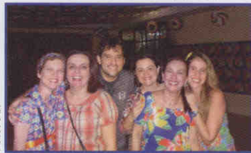
Comissão organizadora da festa