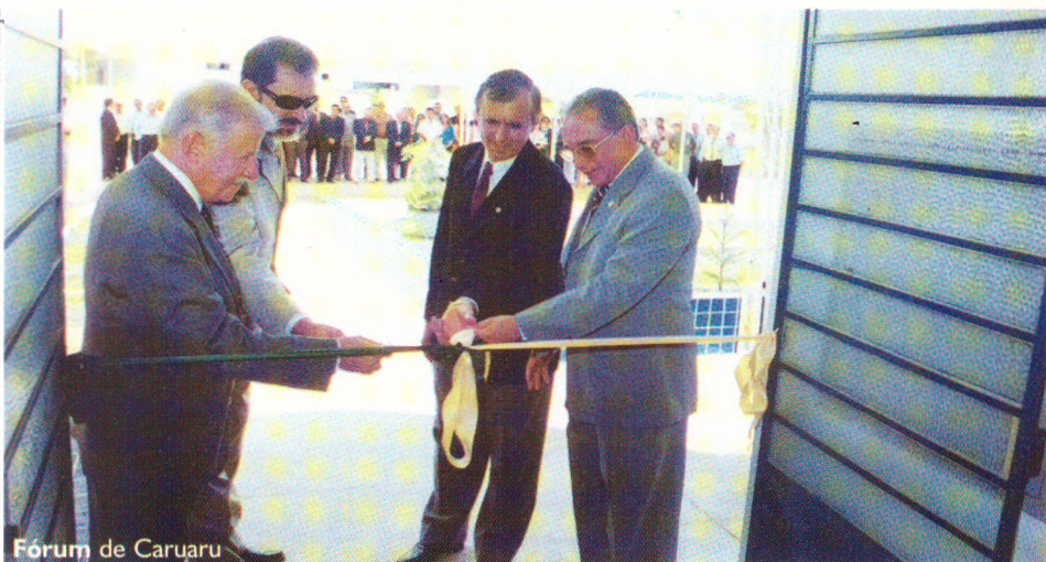
Fórum de Caruaru

Depois de Carpina, primeira comarca pólo a ter um Fórum Eleitoral, inaugurado no final de 2002, Caruaru e Surubim fizeram festa no final de março e comemoraram a conclusão das obras dos novos fóruns. O presidente do TRE-PE, desembargador Antônio Camarotti, foi o mestre de cerimônia nas duas inaugurações que contaram com a presença de autoridades locais. Ao todo, serão doze comarcas pólo que vão ter fóruns próprios. O objetivo é descentralizar a atuação, me-