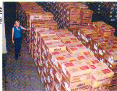
Urnas aguardando transporte

preparação estrutural do pleito para a Secretaria de Informática, adequação dos prédios e a distribuição das urnas em todo o Estado, é responsabilidade da Secretaria de Administração. Tudo isso tem que ser feito sem esquecer das atribuições normais inerentes ao funcionamento da casa.