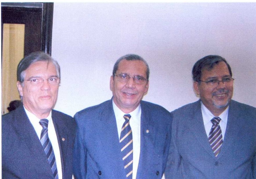
Boca-de-urna: Comissão não vai tolerar abusos de irregularidades