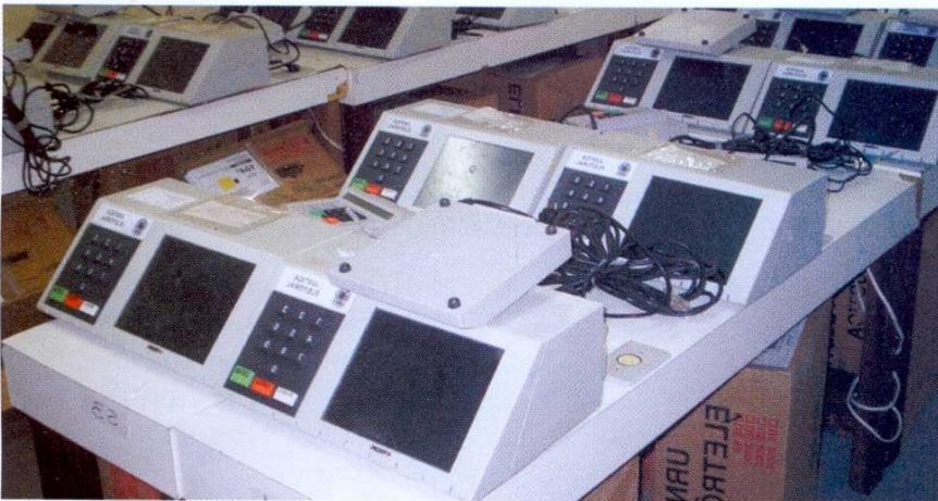
Urnas: Cerca de 18,5 mil equipamentos serão usados no pleito de 1º de outubro

Os técnicos do TRE já prepararam as 18,5 mil urnas eletrônicas que serão usadas no dia 1º de outubro. Os equipamentos receberam as fotos e