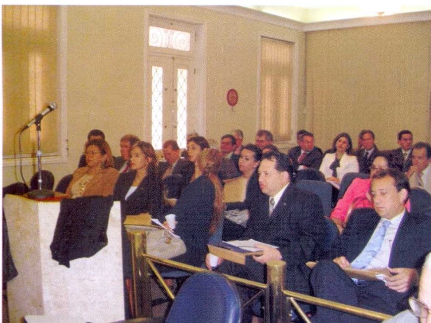
Reunião: TRE passa instruções para juízes que irão atuar nas cidades termos

O material com orientações está à disposição para os candidatos e coordenadores de campanha, no site do tribunal: www.tre-pe.gov.br