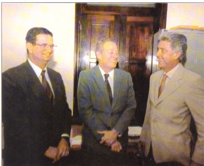
DESEMBARGADORES auxiliares julgam os recursos