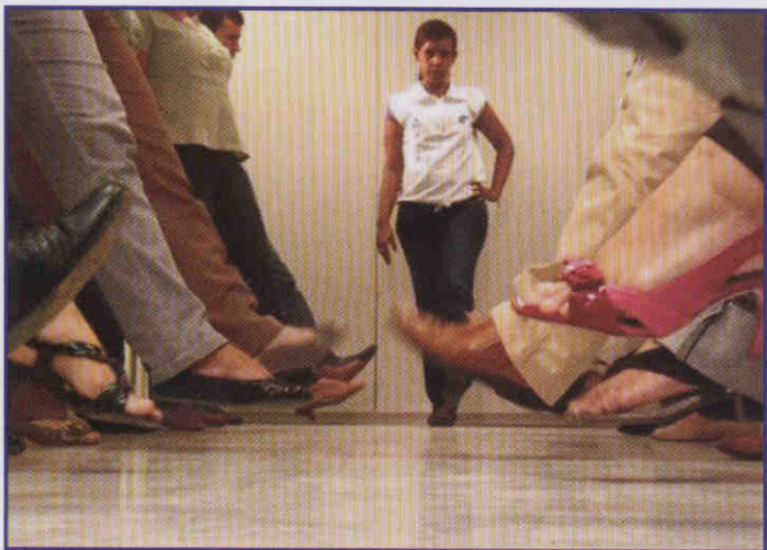
GINÁSTICA LABORAL: Garantiu o sucesso do programa