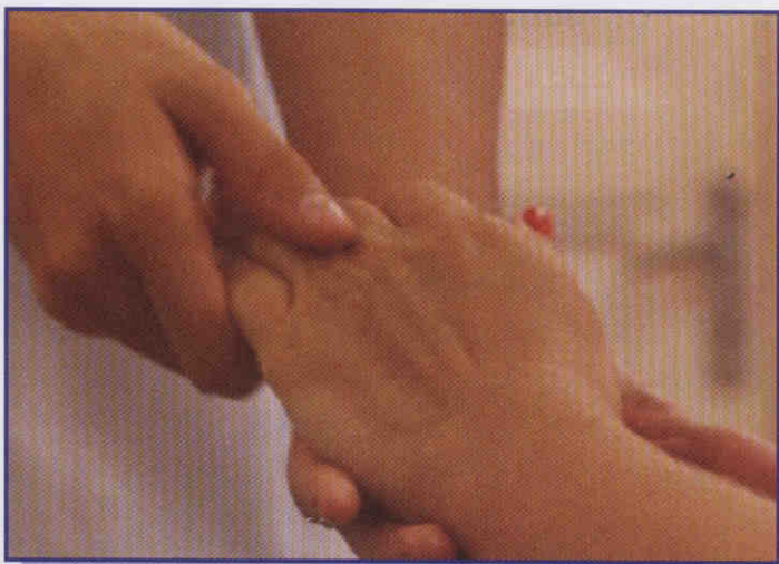
MASSAGEM: Para relaxar as tensões dos servidores