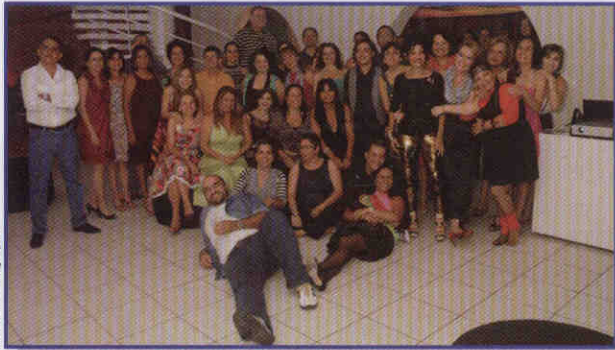
Turma: A foto histórica dos servidores

FESTA - Servidores efetivos do TRE-PE, que ingressaram nos concursos públicos realizados em 1984 e 1989, fizeram uma noite dançante, no último dia 22 de outubro, em comemoração às duas décadas de serviços prestados.