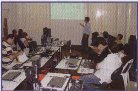
Capacitação: Servidores se preparam para atender a população