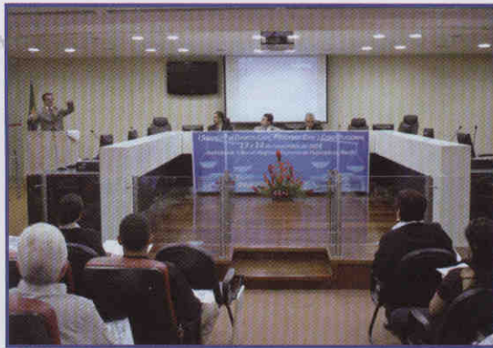
Pleno: O Simpósio ocorreu na sede do TRE-PE