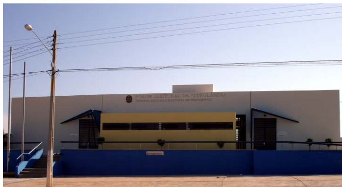
INFRA-ESTRUTURA O prédio conta com novas e modernas instalações

Para se ter uma idéia do esforço empreendido, a construção, em um terreno de 1,8 mil metros quadrados, doado pela