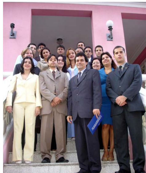
ENCONTRO 18 magistrados conheceram o TRE