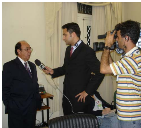
NOTÍCIA A imprensa deu grande destaque ao pleito