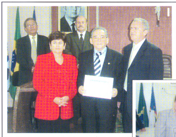
1 - Santa Cruz do Capibaribe 2 - Toritama 3 - São Bento do Una

Com merecimento, no mês de junho, foi oficializado o recebimento de Título de Cidadão ao presidente do TRE-PE, Antônio Camarotti, concedido pelos municípios de São Bento do Una, Toritama e Santa Cruz do Capibaribe. As homenagens são um justo reconhecimento pela dinamização da Justiça Eleitoral nas localidades com a implantação do título de eleitor on line .