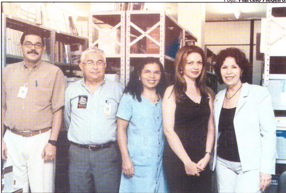
A equipe da biblioteca presta serviços de informação e pesquisa a usuários internos e externos

os de informações atuais”, completa. Outro serviço importante é o “alerta”, por meio de intranet, intitulado de Biblioteca Informa, com notícias sobre novas normas e/ou modificações ocorridas em leis e resoluções, além de dados publicados nos diários oficiais. Apesar do empréstimo ser feito apenas para os servidores do TRE-PE, usuários comuns podem realizar consultas no local, com o apoio