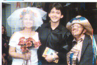
Em clima de festa, os servidores vestiram-se a caráter, com direito a casório e um padre para lá de animado