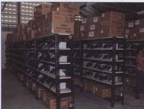
Reciclagem: Urnas tem fim ecológico

Para as eleições 2010 o TSE deverá comprar mais de 100 mil urnas, entre elas a de reconhecimento biométrico, ou seja, que identifica o eleitor com a impressão digital. Também no próximo ano, vai ser a vez do descarte das urnas 98, utilizadas pela última vez nas eleições municipais de 2008.