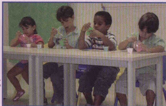
Criatividade: As brincadeiras foram de cunho educativo