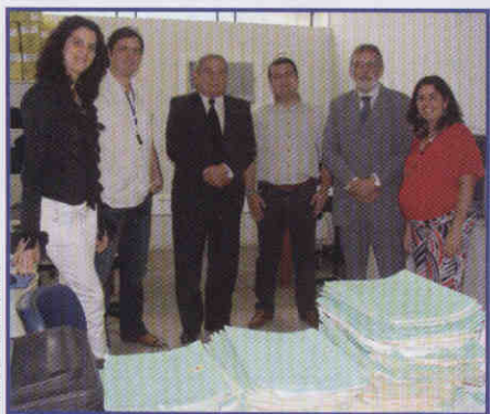
META: Corregedor fiscaliza em Surubim

A participação deste Regional também tem feito a diferença. As zonas eleitorais (ZE) do Estado estão empenhadas para garantir um bom percentual, o julgamento dos processos e já atinge um total de 45,87%. O coordenador desse processo, desembargador Saulo Fabianne, empenhou-se pessoalmente para o sucesso do Meta 2. O presidente Roberto Lins, em sessão do pleno, falou do ótimo desempenho do tribunal e a atuação de Fabianne: "A Meta 2 não teria evoluído se não tivéssemos a tenacidade para atingir os feitos. Sinto-me feliz e orgulhoso em estar alcançando os objetivos e contribuindo para o Judiciário. O desembargador Saulo foi um ótimo fiscalizador dessa resolução", elogiou em público.