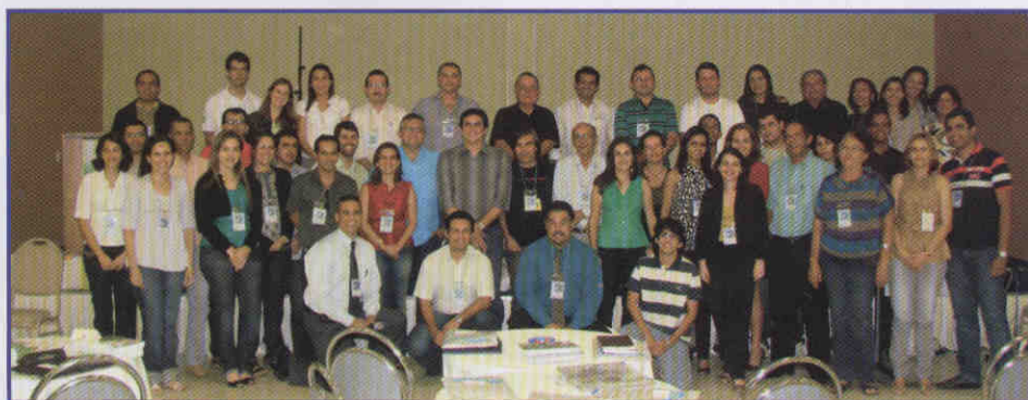
Turma: Servidores do Tribunal Regional Eleitoral participam do curso

um exemplo de preocupação com os cidadãos, teve iniciativa da corregedoria deste Regional. A meta do programa, de fazer renovação na prática e de desenvolver os trabalhos dentro de um cartório foi totalmente atingindo. Corregedoria e servidores saíram das aulas atualizados e satisfeitos com a troca de informações.