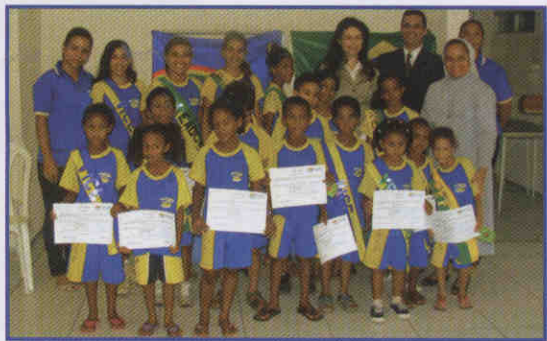
A EJE ensina a importância da votação

Todas as etapas de uma eleição normal são cumpridas, inclusive com a formação das mesas receptoras de votos, emissão de boletins de urnas, fiscalização dos partidos "fictícios", apuração, totalização dos votos, proclamação dos eleitos, encerrando as atividades com a diplomação dos mais votados.